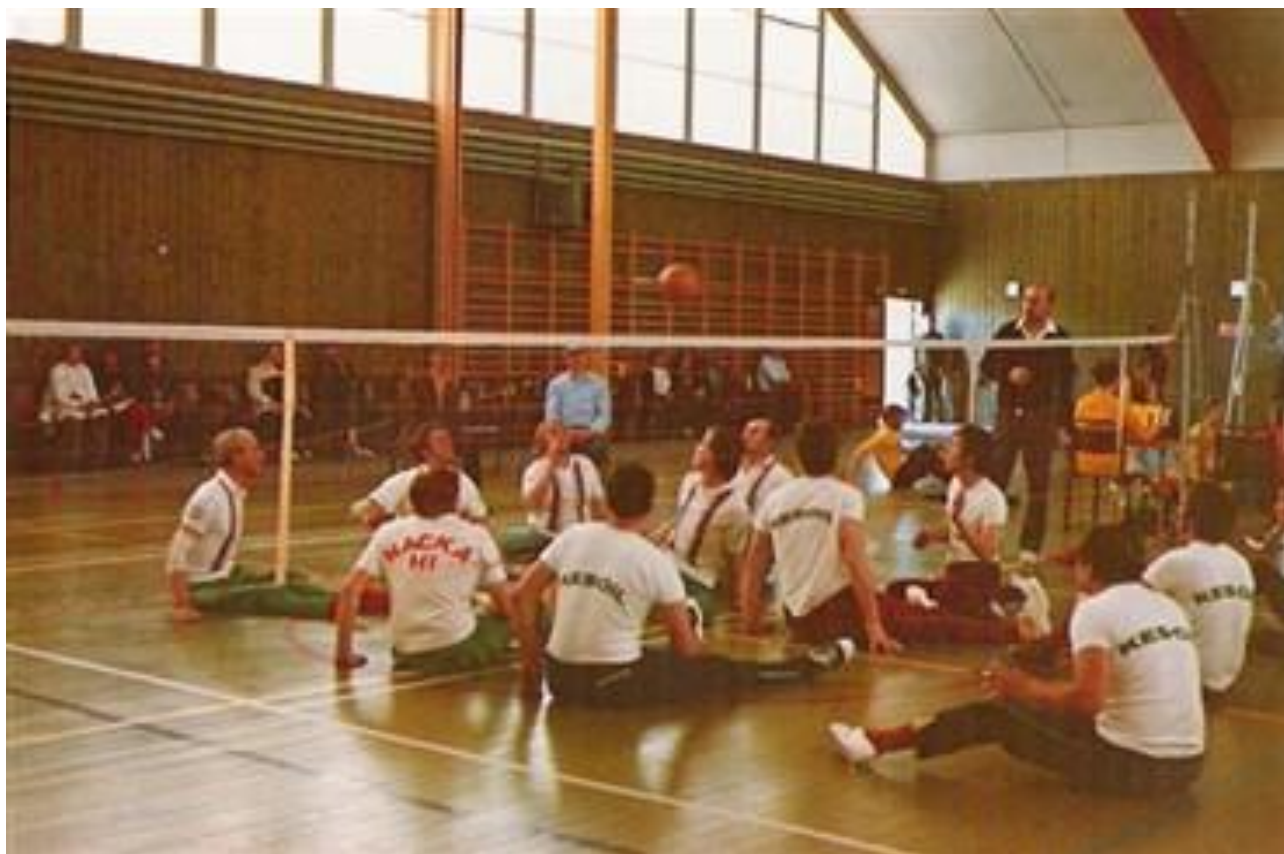
Tampereen Kesoilit nackailemassa Göteborgissa