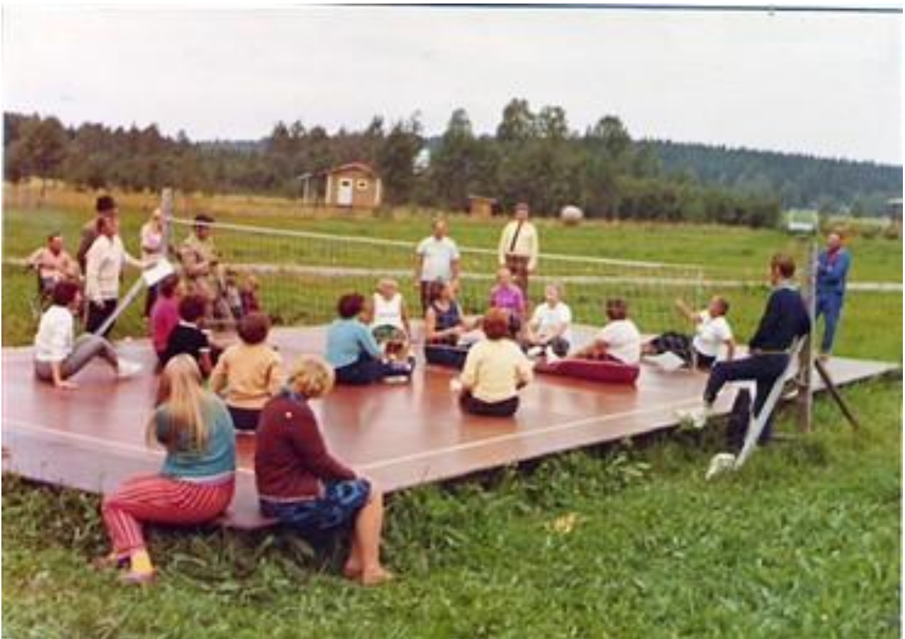
Helsingin naiset vierailulla Lahden kesäkodin "lavalla" elokuussa 1970